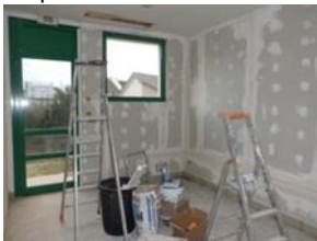
Un atelier multi services