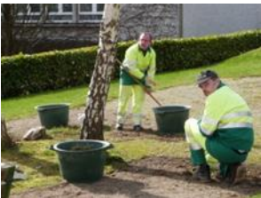
Plusieurs ateliers d'entretien des espaces verts sur Guipavas, Brest et Plabennec

Au sein des ateliers de production des ESAT de Guipavas et Plabennec, les participants seront accompagnés par les Encadrants Techniques.