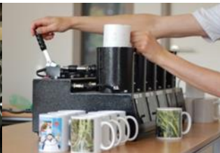
Un atelier de prestations en /aux entreprises sur Guipavas et Plabennec