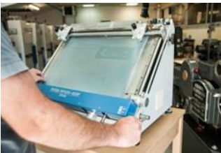
Un atelier imprimerie sur Plabennec