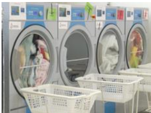
Un atelier blanchisserie, d'une superficie de près de 1300 m 2 sur Guipavas