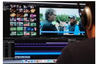
Un atelier audiovisuel Sur Guipavas