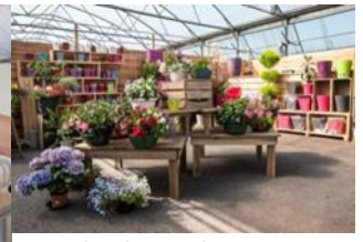
Un atelier horticulture sur Plabennec